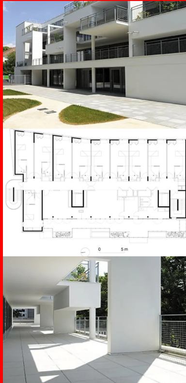
Les éléments de la structure béton sculptent la façade ouest.