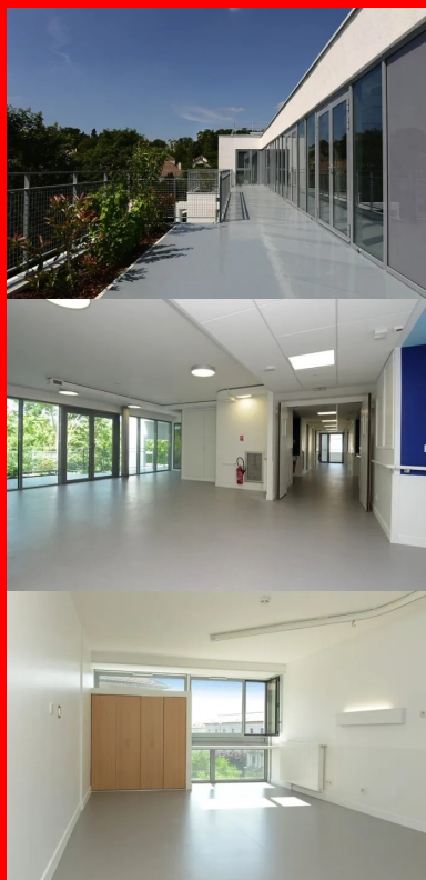
Au dernier étage, les salles d'activités sont dotées de vastes baies vitrées ouvertes sur le paysage.

Ces jardins suspendus sont conçus en quinconce de façon à créer des points de vue et des perspectives variés grâce à un jeu d'éléments architecturaux - les piliers de la structure, des voiles verticaux, les jardinières, les garde-corps. Le lien visuel permanent, sur un même niveau, mais également d'un étage à l'autre permet aux uns et aux autres de se rencontrer sans être obligés de monter ou de descendre. Les dalles des terrasses sont construites dans la continuité des dalles intérieures, avec juste un seuil de 2 cm de hauteur qui n'empêche pas le passage des fauteuils. La ventilation naturelle du bâtiment, sa double orientation est/ouest et son inertie créent un confort d'hiver comme d'été ; le bâtiment est certifié Cerqual, H&E, BBC Effinergie 2005. Les matériaux béton , menuiseries alu, verre, émailithe) et les teintes limitées (gris, blanc, noir), l'écriture architecturale sans ostentation et la conception simple mais soignée dans le moindre détail apportent aux habitants un sentiment de considération et de prise en compte de leur situation difficile.