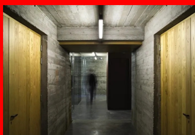
Vue des espaces du sous-sol.

Seul le mur du fond est en béton lissé à la taloche et épouse la pente du mont Gerbier. Elle est couverte par une verrière, portée par une structure en béton constituée de poutres croisées à angle droit. Ces poutres sont surdimensionnées pour obtenir une épaisseur, pour accrocher l'ombre et la lumière, pour créer un rythme de plein et de vide, qui dissimule les menuiseries de la verrière. Toutes les poutres transversales sont inclinées dans le sens de la pente. Elles composent tout un ensemble de vues cadrées en contreplongée sur le mont Gerbier-de-Jonc, qui participe à la mise en scène du lieu.