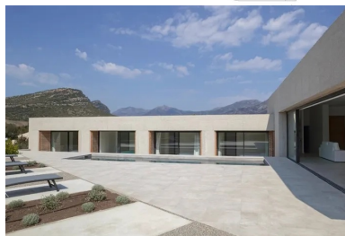
Chaque chambre est conçue comme un studio indépendant et toutes possèdent une loggia donnant sur la piscine.

La maison est construite en béton coulé en place avec des voiles de refend et des murs de façade porteurs. Les voiles intérieurs ont un parement brut de décoffrage , animé par l'empreinte des panneaux en épica mis en œuvre dans les bandes de coffrage métalliques. Toutes les parois en béton en contact avec l'extérieur sont sablées. Elles laissent apparaître un gravier blanc, sec et aux arêtes franches qui fait écho aux collines de calcaire. Ainsi, l'expression minérale de cette architecture entre en résonance avec le site et l'esprit du lieu.