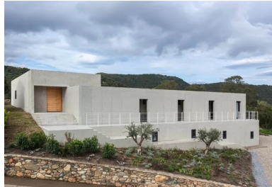
La maison se déploie par un jeu de volumes en béton sablé aménagés dans la pente.

« Un coup de pelle a suffi à révéler le secret géologique d'Oletta, laissant apparaître, à la lumière crue, un radeau de calcaire perdu au milieu de ce cirque granitique qu'est la Corse », expliquent les architectes Buzzo et Spinelli. « La tendresse de cette pierre nous a invités à penser le projet non plus comme un édifice, mais à concevoir l'espace en creux. Le projet naît de l'idée de la mise au jour d'une masse minérale monolithique extraite du sol. Comme la pièce de glaise déposée sur le tour du potier, le bloc s'installe en promontoire sur le terrain pour offrir sa masse aux ciseaux du sculpteur. »