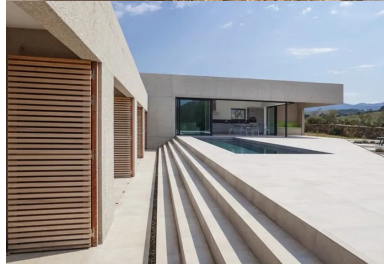
Dans le volume qui domine la composition sont regroupés les lieux de la vie commune, qui s'ouvrent sur l'extérieur et la piscine par une généreuse baie vitrée en angle.