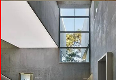
le hall est le cœur du conservatoire. le volume de la bibliothèque, disposé en pont sur le hall, vient ponctuer la dilatation verticale de l'espace.