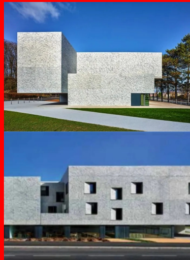
L'entrée est signifiée par un volume en porte-à-faux de 17m dont la mise en lévitation crée un appel.

« Ce bâtiment propose une morphologie et une échelle qui expriment une certaine force dans l'esprit du lieu et de son histoire. C'est un monolithe de béton qui affiche une présence énigmatique. La matière du béton brut manifeste parfaitement ici le volume et la masse recherchés. Cependant, je ne voulais pas que le parement reste totalement brut. Je souhaitais donner un ton un peu bleuté au béton et que sa peau soit en écho avec la végétation du bois d'Essert. Pour répondre à ces objectifs, l'idée de réaliser un dripping sur les façades avec deux teintes de bleu s'est imposée. Cela permet de laisser le béton vivre tout en lui donnant une texture bleutée inhabituelle. Les jets de peinture donnent de la profondeur et une épaisseur à la peau du bâtiment. Les surfaces vibrent sous la lumière, elles semblent en mouvement, la matière n'est plus statique. Il est aussi très intéressant de constater que certaines personnes pensent à des marbres, tandis que d'autres y voient un motif plutôt végétal. Chacun peut avoir sa lecture et son interprétation de cette texture », commente Dominique Coulon.