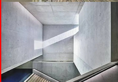
L'espace généreux et lumineux du hall se dilate dans le bâtiment.