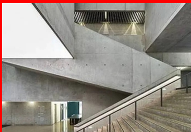
L'espace généreux et lumineux du hall se dilate dans le bâtiment.

Le dripping sur les façades a été réalisé par deux artistes, Max Coulon et Gabriel Khokha. Ils ont fabriqué des pinces spéciales et mis au point la technique de projection spécifique. Ce sont deux nuances de bleu d'une peinture extérieure pour bâtiment qui ont été projetées à partir d'une nacelle, sur les façades en béton brut préalablement recouvertes d'une protection hydrofuge . L'ensemble de cette intervention s'est déroulé sur environ un mois et demi.