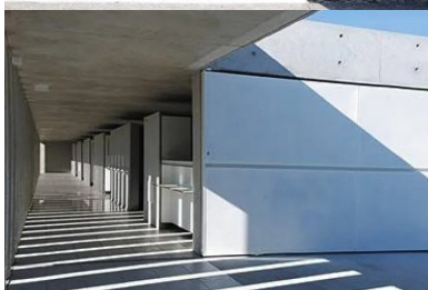
Le parcours allant de l'entrée à la baignade est organisé dans une marche en avant à travers une galerie pleine de lumière éclairée naturellement par le claustra.