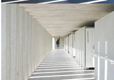
Le parcours allant de l'entrée à la baignade est organisé dans une marche en avant à travers une galerie pleine de lumière éclairée naturellement par le claustra.