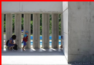
Le parcours allant de l'entrée à la baignade est organisé dans une marche en avant à travers une galerie pleine de lumière éclairée naturellement par le claustra.

En référence aux volets des anciens bâtiments, les profondeurs des cours/patios de l'accès et du snack sont accentuées par des aplats de peinture bleue. L'ensemble est construit en béton armé coulé en place. La réalisation du grand claustra de 38 m de long a fait l'objet d'une attention particulière au niveau de sa préparation, de sa mise en œuvre et de son décoffrage . Avec sa faible hauteur, le bâtiment trouve aisément sa place dans le site. Les arbres le dominent. Son architecture affirmée et contemporaine semble avoir été toujours présente dans le paysage.