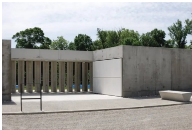
Le claustra en béton règle les relations entre intérieur et extérieur.

« Les bâtiments d'accueil, de vestiaires et le snack présents sur le site avaient le charme des « bons bâtiments » des années 60 mais ne pouvaient pas être adaptés correctement et conservés. Leur échelle mesurée, leur relation à la lumière naturelle, la simplicité des matériaux et la couleur bleue sont restées dans la conception de notre projet. À cela s'ajoute notre volonté de remettre la piscine d'été en relation avec les qualités du site, notamment le vallon de l'Aigubelle qui contient la bastide de Saint-Lys sur son autre rive », souligne Benjamin Van Den Bulcke de l'atelier ATP.