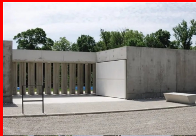
Le claustra en béton règle les relations entre intérieur et extérieur.

« Les bâtiments d'accueil, de vestiaires et le snack présents sur le site avaient le charme des « bons bâtiments » des années 60 mais ne pouvaient pas être adaptés correctement et conservés. Leur échelle mesurée, leur relation à la lumière naturelle, la simplicité des matériaux et la couleur bleue sont restées dans la conception de notre projet. À cela s'ajoute notre volonté de remettre la piscine d'été en relation avec les qualités du site, notamment le vallon de l'Aiguebelle qui contient la bastide de Saint-Lys sur son autre rive », souligne Benjamin Van Den Bulcke de l'atelier ATP.