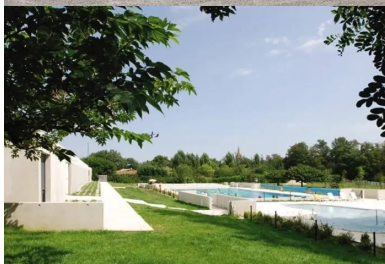
La piscine d'été dans le paysage naturel.