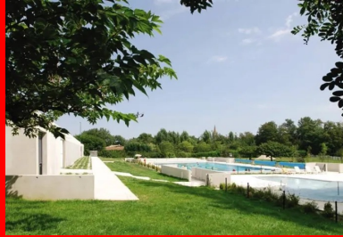
La piscine d'été dans le paysage naturel.