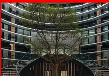
L'atrium amène la lumière au cœur du bâtiment et, par ses ouvertures en partie haute, participe à sa ventilation naturelle.

Réalisé dans le cadre d'un partenariat public-privé (PPP), ce nouveau palais de justice rassemble le tribunal de grande instance pénal et civil (TGI), le tribunal d'instance (TI) et le tribunal pour enfants jusque-là éparpillés sur plusieurs sites, dans des bâtiments de moins en moins adaptés. Cent soixante-dix personnes y travaillent et en moyenne trois cents personnes par jour y sont accueillies. Comme le souligne Marie-Christine Leprince-Nicolay, la présidente du TGI : « La justice a beaucoup évolué de même que les normes. Aujourd'hui, l'accueil et la prise en charge du justiciable s'effectuent à travers un guichet unique de greffe (Gug) par des personnes qualifiées à même de renseigner et d'orienter. Un renforcement conséquent de la sécurité se traduit par des circulations dédiées et un contrôle systématique à l'entrée. Enfin, la prise en compte du confort et des conditions de travail du personnel est désormais acquise. » Elle ajoute : « Si, au départ, l'idée de changer de lieu de travail fut un peu difficile à accepter pour certains, le fait d'avoir suivi le déroulement du projet leur a permis de se l'approprier et de l'adopter. Les personnels ont pu suggérer des améliorations en cours de réalisation dont l'Agence publique pour l'immobilier de la justice (Apij) a tenu compte. »