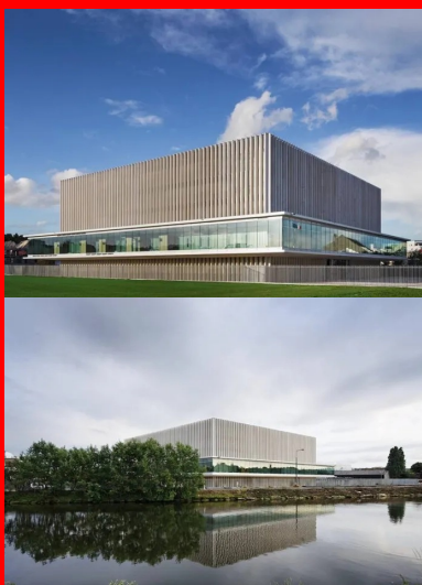
Angle sud-ouest, expression d'une justice égalitaire, les quatre façades sont quasi identiques, la colonnade en béton clair joue comme des ventelles plus ou moins ouvertes suivant le point de vue adopté.

Le palais de justice prend place sur la pointe de la presqu'île comprise entre le canal, le bassin Saint-Pierre et le chenal Victor Hugo, est bordé au nord par le chemin de halage qui, 15 km plus loin, rejoint la mer ; la zone est inondable. Il fait face à la bibliothèque multimédia à vocation régionale (BMVR), conçue par OMA/Rem Koolhaas architectes, dont il est séparé par une vaste pelouse de 2 hectares.