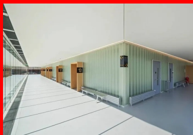
Originalité de ce palais de justice, la salle des pas perdus. Placée au 1er étage, en périphérie des salles d'audience, elle s'ouvre sur l'extérieur par des baies vitrées.

Grâce à l'ensemble de ce système, mis au point avec l'entreprise, très vite, toute la structure périphérique a été mise en place, dessinant la forme définitive du palais de justice. Les colonnades de béton blanc se sont ainsi imposées dans le paysage de la presqu'île, faisant écho à la pierre de Caen utilisée depuis le XIe siècle.