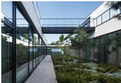
Les ateliers s'ouvrent sur les patios plantés de la douve.