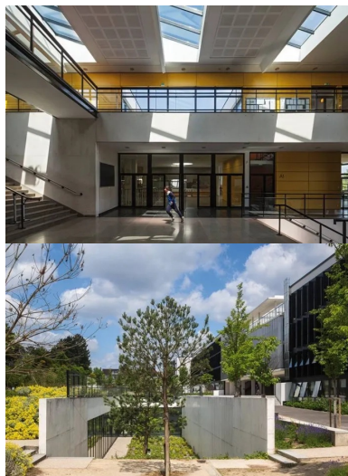
La galerie distribue la salle polyvalente, la restauration, le CDI et l'administration. Ici, vue sur l'accès au restaurant.

Une grande Douve creusée entre cour et jardin révèle leur présence. Elle accueille des patios plantés, sur lesquels s'ouvrent les ateliers par de vastes baies vitrées. Aujourd'hui, les 2 100 élèves du lycée disposent d'un environnement naturel agréable.