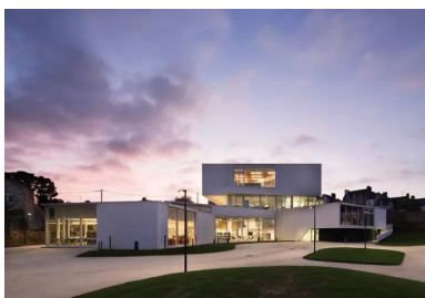
Les masses de béton sont en lévitation grâce aux jeux de transparence.

Le rez-de-jardin abrite la scène de l'auditorium ainsi que l'espace de la médiathèque à proprement parler. Les architectes souhaitaient que le public garde le lien visuel direct avec le jardin ; il existe d'ailleurs un accès donnant sur ce jardin. La grande salle de lecture s'élève sur une double hauteur, dans laquelle sont pris des éléments construits en porte-à-faux : les locaux du personnel, une cuisine ouverte sur la médiathèque, les archives, une salle polyvalente qui accueille les élèves pour travailler. Il s'agit d'un système de petites boîtes dans la boîte, habillées de bois. Entre chaque boîte, sont aménagés des petits salons conviviaux donnant sur la salle, où peuvent se retrouver par exemple les membres d'une association ou les parents venus attendre leurs enfants... Là encore, un garde-corps en verre permet un lien visuel continu.