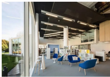
L'espace de la médiathèque garde un lien visuel direct avec le jardin.