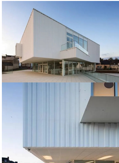
Un vaste belvédère est créé dans la continuité du hall d'accueil.