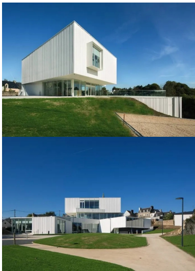
Jeu de contraste entre la masse assez fermée du musée à l'étage et l'espace vitré de l'accueil.

À la suite d'un concours , est donc sorti de terre un vaste bâtiment abritant la médiathèque, le musée (existant depuis plusieurs décennies, mais pas mis en valeur) ainsi qu'un auditorium de 80 places.