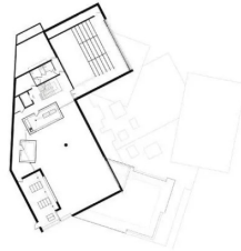
Plan r+1: 1. Locaux techniques 2. Espace scénique 3. Gradins fixes 4. Salle de repos 5. Archives 6. Salle d'activités

Le béton, par son inertie thermique pour le confort d'été et d'hiver, était aussi un choix des architectes pour répondre à la RT 2012. D'ailleurs, leur démarche dans ce sens ne s'arrête pas là, avec la végétalisation des toitures, l'installation d'une chaudière à bois permettant de recycler les déchets verts de la commune, l'orientation des volumes et de leurs ouvertures, ainsi qu'une isolation intérieure et une ventilation double flux. Le bâtiment présente donc d'incontestables qualités énergétiques, alliées à une conception résolument contemporaine, assez inattendue dans une petite commune du cœur de la Bretagne.