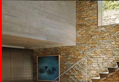
Depuis l'intérieur, le panorama s'offre par des ouvertures tour à tour vastes comme des écrans géants, ou cadrées comme des plans fixes.