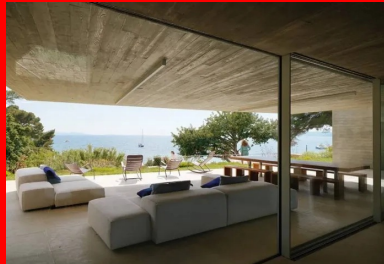
Les espaces communs ouvrent sur un vaste salon d'été protégé des pluies, du vent et du soleil brûlant du midi par un généreux porte-à-faux.

Issu d'un lotissement des années 70, le terrain est une pépite de la Riviera, réservée à sa descendance par l'acqureur de l'époque. Il comprend deux accès. Un premier depuis la route supérieure, un second au bout d'une petite voie descendant vers la côte. C'est par ce chemin bas que l'on accède aujourd'hui à la propriété, comme si l'on arrivait de la mer. Là, entre la plage et les premiers contreforts rocheux, se développe le pavillon d'entrée : un long parallépipède revêtu de bois sous lequel sont aménagés les garages. Sa toiture-terrasse accueille un deck que prolonge une piscine à débordement, rectangulaire et longiligne. Ainsi disposé, le bassin en inox trace une ligne d'eau turquoise dans le paysage verdoyant. Implantée au-dessus, la maison principale est desservie par les circulations douces qui gravissent les terrasses du jardin et par un ascenseur qui perforé la roche pour rejoindre les hauteurs.