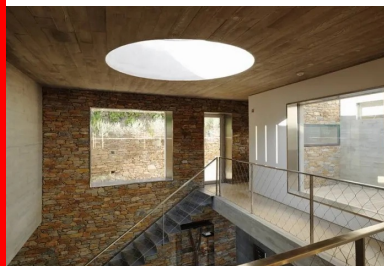
Depuis l'intérieur, le panorama s'offre par des ouvertures tour à tour vastes comme des écrans géants, ou cadrées comme des plans fixes.