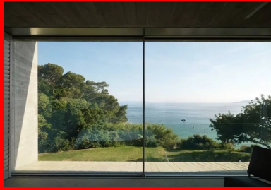
Depuis l'intérieur, le panorama s'offre par des ouvertures tour à tour vastes comme des écrans géants, ou cadrées comme des plans fixes.

Le projet profite également d'un chauffage au sol et d'une ventilation double flux mais c'est bien grâce à l'inertie du béton et à une conception bioclimatique en parfaite concordance avec le site qu'est assuré le confort de cette résidence exposée au souffle brûlant de l'été comme aux pluies de l'hiver.