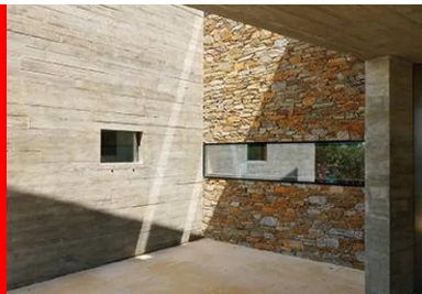
Les parois extérieures, les plafonds et les refends intérieurs sont réalisés en béton brut dans des coffrages en pin.