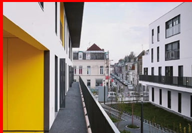
L'immeuble haut est desservi par des coursives donnant sur le jardin aux étages impairs, et sur la future voie prévue par la ville pour les étages pairs.

Le projet conçu par l'architecte Sophie Delhay propose d'enrichir la rue de Lannoy par une nouvelle séquence végétale. Il se compose de deux immeubles parallèles, disposés perpendiculairement à la rue Lannoy. Ilsenserrent un jardin ouvert sur la rue et l'espace public très minéral du quartier. Chacun des deux immeubles s'inscrit dans le gabarit de ses voisins, sans chercher à aplanir les différences existantes. L'un est bas et découpé, dans la continuité des maisons ouvrières, tandis que l'autre, qui fait face à la salle des fêtes, s'élève à 21 m de hauteur. Cette similitude d'échelle instaure un dialogue entre les deux bâtiments, de part et d'autre de la future voie, qui sera créée entre eux.