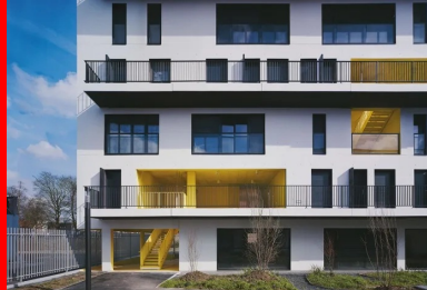
Différents espaces à partager, peints en jaune, traversent le grand immeuble et sont offerts à l'appropriation des habitants.