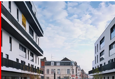
Le jardin s'ouvre sur la ville.