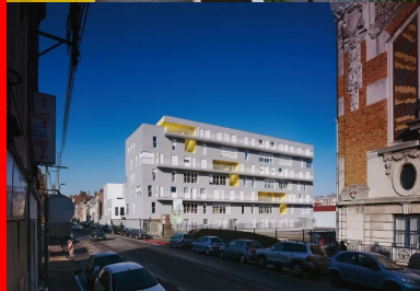
Chacun des deux immeubles s'inscrit dans le gabarit de ses voisins.