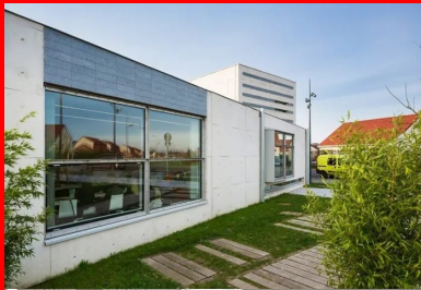
Façade orientée à l'est, à l'abri de la circulation.

Le soutien de la région Nord-Pas-de-Calais a été déterminant, tant sur le plan financier (80 % du budget) que pour le montage du projet qui aura pris trois ans. Toutes les étapes du projet se sont déroulées en concertation avec les élus, mais aussi avec les habitants, invités régulièrement à participer à des réunions d'information puis à suivre le déroulement du chantier et jusqu'à l'inauguration à laquelle tous étaient conviés ; 4 000 personnes étaient présentes. Depuis, ouverte 6 jours sur 7 à raison de 44 heures hebdomadaires, la médiathèque accueille en moyenne 200 personnes par jour de tous âges et de toutes origines ! Le nombre d'inscrits comme de prêts a explosé. Elle a reçu le prix de l'accueil au Grand Prix Livres Hebdo 2015 de bibliothèques francophones.