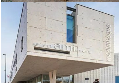
Pignon ouest, sa faille vitrée permet d'éclairer le bureau qu'il abrite. En porte-à-faux au-dessus du parvis, il définit une surface extérieure de transition dans le prolongement de l'espace des périodiques et de l'estaminet.