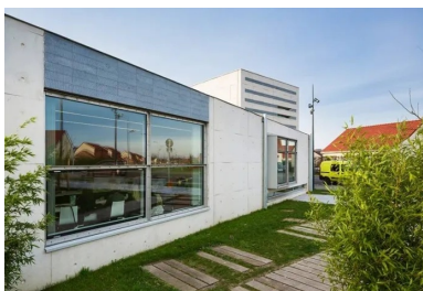
Façade orientée à l'est, à l'abri de la circulation.

Le soutien de la région Nord-Pas-de-Calais a été déterminant, tant sur le plan financier (80 % du budget) que pour le montage du projet qui aura pris trois ans. Toutes les étapes du projet se sont déroulées en concertation avec les élus, mais aussi avec les habitants, invités régulièrement à participer à des réunions d'information puis à suivre le déroulement du chantier et jusqu'à l'inauguration à laquelle tous étaient conviés ; 4 000 personnes étaient présentes. Depuis, ouverte 6 jours sur 7 à raison de 44 heures hebdomadaires, la médiathèque accueille en moyenne 200 personnes par jour de tous âges et de toutes origines ! Le nombre d'inscrits comme de prêts a explosé. Elle a reçu le prix de l'accueil au Grand Prix Livres Hebdo 2015 de bibliothèques francophones.