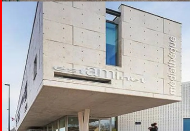
Pignon ouest, sa faille vitrée permet d'éclairer le bureau qu'il abrite, en porte-à-faux au-dessus du parvis, il définit une surface extérieure de transition dans le prolongement de l'espace des périodiques et de l'estaminet.