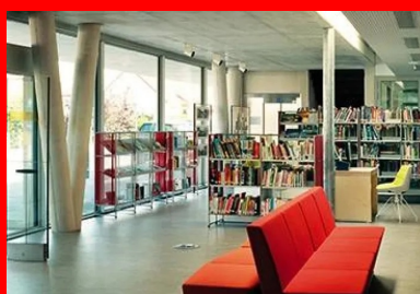
Hall d'entrée où s'avance la salle de lecture, le plafond béton, correspond à la partie du bâtiment de deux niveaux, une faille vitrée marque la transition avec la partie de plain-pied.

Par ailleurs, l'association de la massivité du béton, de l'étanchéité des terrasses végétalisées avec la transparence et la finesse des façades en verre permet d'obtenir une inertie thermique importante et d'assurer la conformité à la RT 2012. Le confort d'été comme d'hiver est assuré, tout en privilégiant l'éclairage naturel.