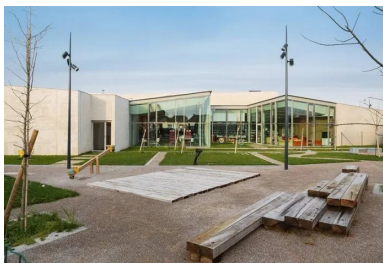
À l'arrière, les salles transparentes de la médiathèque semblent incluses dans le jardin.

Édifiée à la convergence des trois cités, créant un lien matériel et visuel, elle achève de donner une centralité, là où auparavant se trouvait un terrain vacant. Équipement public original, elle rassemble des fonctions traditionnellement éparées - services municipaux, café, salle de spectacle, etc. Dans un même bâtiment, les visiteurs peuvent passer du temps à consulter un livre, un journal, tout en attendant un rendez-vous à la PMI et en buvant un café ou une « Page 24 », une bière locale au nom prédestiné. Parce qu'elle est incluse au milieu d'autres activités, éventuellement soutenue par des animations, la lecture devient accessible à tous. C'est du moins le pari qui est fait là.