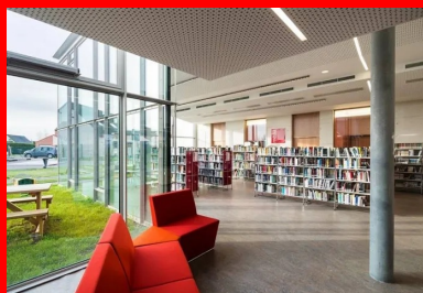
Salle de lecture et d'écoute de la médiathèque entièrement vitrée sur le jardin, les poteaux en béton implantés en retrait de la façade, signalent la structure.

Les trois volumes qui se déploient en éventail à l'arrière du premier contiennent respectivement la médiathèque et les ateliers, les bureaux de services sociaux et une salle réservée aux enfants, la salle de diffusion pouvant accueillir aussi bien des réunions, des conférences que des spectacles ou des expositions. Les façades sud des deux premiers sont vitrées sur le jardin aménagé à l'arrière. La salle de diffusion, différenciée depuis l'extérieur par son volume angulé habillé de tôles d'acier laqué perforées, peut, selon son programme, occulter toute lumière extérieure ou bien s'ouvrir complètement sur l'estaminet ou encore partiellement sur le parvis nord-ouest. La partie organisée en ateliers - cuisine, musique, etc. - peut communiquer directement avec la médiathèque ou, à l'inverse, s'en isoler pour accueillir des usagers directement depuis la rue Louis Legay. Toute la parcelle est occupée, entre le bâtiment, le parvis et le jardin.