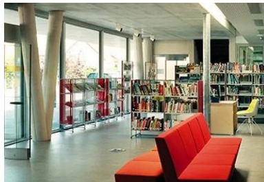
Hall d'entrée où s'avance la salle de lecture. Le plafond béton, correspond à la partie du bâtiment de deux niveaux, une faille vitrée marque la transition avec la partie de plain-pied.

Par ailleurs, l'association de la massivité du béton, de l'étanchéité des terrasses végétalisées avec la transparence et la finesse des façades en verre permet d'obtenir une inertie thermique importante et d'assurer la conformité à la RT 2012. Le confort d'été comme d'hiver est assuré, tout en privilégiant l'éclairage naturel.