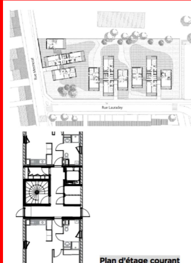
Plan de r+1

Mis en œuvre en alternance dans les différents plots, les deux vocabulaires utilisés pour le dessin des façades favorisent l'identification et l'appropriation des logements par les habitants. Cette combinatoire permet de multiples dispositions et une grande souplesse pour l'usage des loggias, notamment en ce qui concerne leur mode d'occultation et le rapport à l'extérieur. Ainsi, composées de larges ouvertures protégées par des garde-corps transparents, certaines parties assurent de conséquents apports de lumière naturelle et des vues panoramiques sur la ville tandis que des parties pleines traitent l'éternelle question de la dissimulation des stockages extérieurs dans les logements collectifs (vélos, linge, mobilier extérieur...) sans dénaturer l'image générale de l'opération.