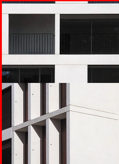
Réalisé en béton blanc, les loggias composent une peau épaisse et qualifient l'opération.

Les coûts engendrés par l'important développé de façade et la multiplication des bâtiments sont couverts par une extrême rationalisation du système constructif. Entièrement réalisés en béton , les édifices associent différentes techniques comme l'indique le plan d'étage courant (ci-dessous). Les noyaux de circulation et les espaces communs contenus dans les plots centraux sont formés par des voiles en béton armé coulés en place qui constituent les structures de contreventement. Les murs extérieurs sont montés en blocs de béton enduits sur des planchers en béton de portée limitée (6,50 m). Plaquées devant les façades principales, les loggias sont réalisées en béton blanc . Elles constituent une peau épaisse qui qualifie l'architecture de l'opération. Le système est composé d'éléments autoporteurs préfabriqués en usine. Implantés dans le prolongement des façades en parpaings enduits, les composants sont solidarisés aux corps principaux des bâtiments. Ils intègrent les rails et les dispositifs de guidage des volets roulants. À l'exception des éléments préfabriqués, les maçonneries sont protégées par un enduit à la chaux dont la finition et la teinte très claire s'allient parfaitement avec celles des panneaux de béton blanc.