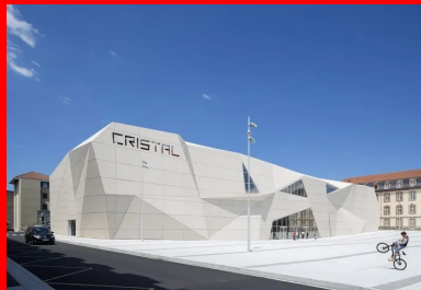
L'implantation sur plusieurs niveaux du complexe cinématographique a permis de libérer une vaste place à l'avant de l'équipement

Respectant les gabarits des bâtiments existants, les angles de la place restent libres et ouverts, laissant le regard du promeneur découvrir, au sud-ouest et au nord-est, les lignes libres et vertes d'un « grand paysage » particulièrement attractif ici. L'inscription dans ces gabarits d'origine, relativement étroits, a ainsi conduit les architectes vers un bâti dense où les salles sont superposées. Cette typologie est atypique pour un multiplexe qui s'organise généralement de plain-pied. Elle présentait en revanche deux avantages : celui de préserver un bel espace pour la place Michel Crespin, et, en second lieu, de réduire les surfaces enterrées nécessitant la mise en œuvre coûteuse de parois étanchées du fait de la présence de la Jordanne à proximité du site.