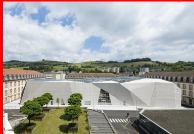
Le bâtiment s'intègre dans le contexte urbain de l'ancienne caserne à la fois au niveau du gabarit du bâti et des axes de composition conservés.

En effet, le projet est profondément urbain. C'est en premier lieu un choix du maître d'ouvrage qui, bien conscient que le cinéma précédent ne correspondait plus aux attentes des clients, a fait le choix de créer un multiplexe en plein centre-ville, et a ainsi mis à disposition le site de l'ancienne caserne. Celle-ci est constituée de trois corps de bâtiment de la fin du XIX e siècle et disposés en « U ». Les concepteurs ont choisi d'implanter le nouveau complexe sur le quatrième côté, face au bâtiment principal de l'Horloge, libérant ainsi une vaste place à la disposition des différentes manifestations organisées par la ville dont le Festival international du théâtre de rue. « Nous avons cherché à reconstituer l'environnement initial de cette ancienne caserne en redonnant grâce à ce qui avait été préalablement la place d'Armes », poursuit Bassel Makarem. Le nouvel équipement occupe ainsi le côté ouest de la place avec des proportions en plan équivalentes à celles de l'existant.