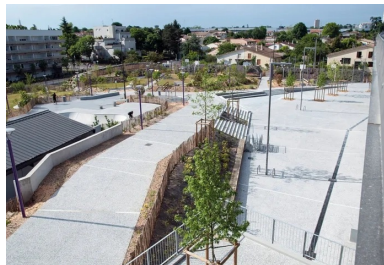
Vue depuis le pôle Brassens-Camus : une vaste « plaine de jeux » arborée s'ouvre sur le quartier Génicart, récemment réhabilité.

contraintes techniques de hauteur de marche pour un escalier et les pourcentages de pente adéquats pour les allées PMR », fait remarquer Eric Salle. Autre impondérable : la météo. « Elle a été défavorable, ce qui a généré beaucoup de retard ! » Enfin, l'ouverture au public de certaines zones du chantier, dès avant son achèvement, a compliqué le travail des équipes de Sols-Aquitaine, composées de cinq coéquipiers pour les bétons à plat et de deux, pour les escaliers et les gradins. « Tous les coulages ont été faits au dumper et directement par camion », précise encore le conducteur des travaux. Il en résulte, malgré les aléas, une superbe réalisation qui fait, à juste titre, la fierté des habitants du quartier Génicart. Une rénovation urbaine réussie, qui doit beaucoup au béton !