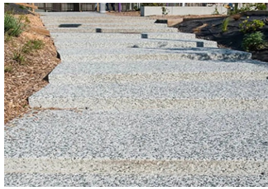
Réalisé en béton désactivé, le cheminement en pas-d'âne qui mène à l'entrée du pôle Brassens-Camus.

skatepark, détaille le conducteur des travaux chez Sols-Aquitaine. Nous avons également réalisé les dalles devant des bancs en béton gris avec une finition peluchée. Pour ce qui est de la scène de hip-hop et de ses gradins, nous avons travaillé sur un béton lisse, comme pour le skatepark. Quant à la coursière, c'est un prolongement du parvis qui rentre dans le bâtiment. »