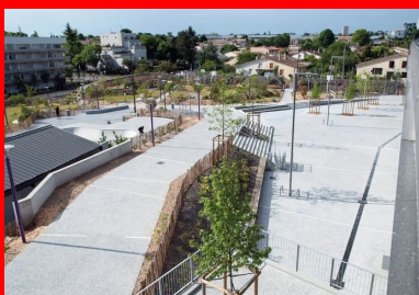
Vue depuis le pôle Brassens-Camus : une vaste « plaine de jeux » arborée s'ouvre sur le quartier Gécicart, récemment réhabilité.

contraintes techniques de hauteur de marche pour un escalier et les pourcentages de pente adéquats pour les allées PMR », fait remarquer Eric Salle. Autre impondérable : la météo. « Elle a été défavorable, ce qui a généré beaucoup de retard ! » Enfin, l'ouverture au public de certaines zones du chantier, dès avant son achèvement, a compliqué le travail des équipes de Sols-Aquitaine, composées de cinq coéquipiers pour les bétons à plat et de deux, pour les escaliers et les gradins. « Tous les coulages ont été faits au dumper et directement par camion », précise encore le conducteur des travaux. Il en résulte, malgré les aléas, une superbe réalisation qui fait, à juste titre, la fierté des habitants du quartier Gécicart. Une rénovation urbaine réussie, qui doit beaucoup au béton !