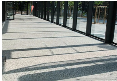
La coursière en béton bouchardé prolonge le parvis à l'intérieur du bâtiment.

« Le chantier a commencé en octobre 2013, mais nos interventions en béton décoratif se sont concentrées dans les quelques mois qui ont précédé la fin du chantier en mai 2016, note de son côté Dominique Noraz, chef de l'agence Sols-Aquitaine. Pour les finitions désactivées, hydrosablées et bouchardées, nous avons utilisé une formule de type C25/30 XF2 S3, avec un mélange de deux agrégats (50 % chacun) possédant la même granulométrie : le premier est un caillou à dominante gris bleuté (10/14C Gris des Pyrénées) et le second, plutôt vert, est une diorite de Thiviers (Périgord). Le ciment est celui de Lafarge Ciment, produit sur le site de La Couronne. Il est de type CEMIIA-LL 42,5R CP2. Cette formule a été fabriquée par Lafarge Béton à Lormont (soit à 3 km du chantier). En ce qui concerne les formules pour les bétons lisses, nous avons utilisé un béton normé de type C25/30 avec un dosage réel de ciment à 350 kg. Au total, nous avons mis en œuvre environ 500 m3 de béton décoratif : cela représente plus de 3 000 m2 d'aménagements sur un site qui est relativement contraint en termes de surface totale au sol, vu les équipements proposés, mais qui donne paradoxalement une réelle sensation d'espace... »