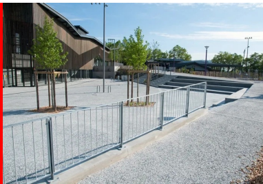
À l'extérieur, le béton désactivé valorise les parvis

Les parvis se situent sur deux niveaux et longent la façade du bâtiment. L'épaisseur du dallage est de 18 cm pour garantir un accès aux pompiers. Les allées PMR ont une épaisseur de 15 cm, tout comme les abords du skatepark, détaille le conducteur des travaux chez Sols-Aquitaine. Nous avons également réalisé les dalles devant des bancs en béton gris avec une finition peluchée. Pour ce qui est de la scène de hip-hop et de ses gradins, nous avons travaillé sur un béton lisse, comme pour le skatepark. Quant à la coursive, c'est un prolongement du parvis qui rentre dans le bâtiment. »