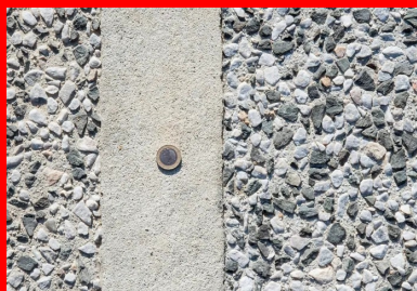
le béton désactivé (à droite du gros plan) intègre deux granulats : un 10/14AC Gris des Pyrénées et une diorite de Thiviers (Périgord)