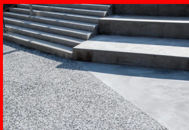
Pour les gradins, c'est le béton lisse qui a été choisi

« Nous avons aménagé des espaces distincts : à l'extérieur, deux parvis, des allées, des gradins devant une scène de hip-hop, des escaliers et des pas-d'âne, ainsi qu'une coursive à l'intérieur du bâtiment, explicite Eric Saille, conducteur des travaux chez Sols-Aquitaine. Pour cela, nous avons utilisé principalement une même formule constituée de deux agrégats de couleur différente, que nous avons déclinée en trois finitions : à l'extérieur, les parvis, allées et pas-d'âne sont désactivés ; les nez de marche et les contremarches des escaliers sont hydrosablés ; et l'intérieur de la coursive est bouchardé. Pour donner du rythme à ces espaces, des bandes structurantes de 10 cm, en béton gris , lient l'intérieur à l'extérieur. Elles permettent d'amener "l'œil" du parvis aux allées et jusqu'au skatepark en béton noir taloché fin, en passant par la scène de hip-hop et les gradins en béton lisse.