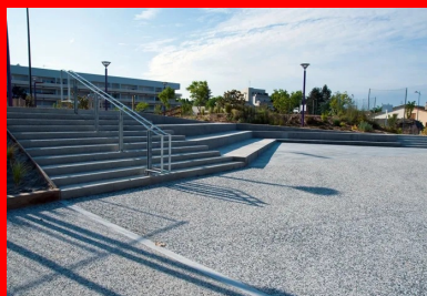
Les nez de marche et les contremarches des escaliers sont en béton hydrosablé

Dévalorisé, enclavé, mal desservi, Génicart était un quartier dit « sensible » de quelque 7 000 habitants, jeunes, en majorité locataires, pour la plupart en difficulté d'emploi ou à petits revenus. Pour améliorer les conditions de vie et remettre à niveau l'environnement dégradé, la municipalité a lancé un vaste plan de réaménagement : réhabilitation ou construction de logements, embellissement des espaces extérieurs, amélioration de la circulation avec la création d'une nouvelle rue, construction de plusieurs équipements publics d'envergure... Point d'orgue de ce processus : l'édification du pôle Brassens-Camus, vaste polygone en béton (y compris les cheminements intérieurs), à la façade de bois et de verre.