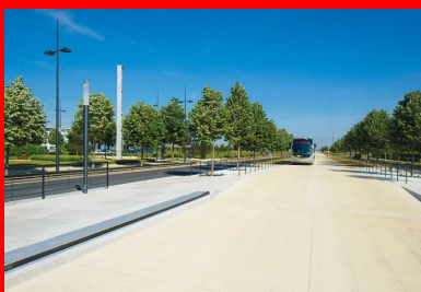
La voie dédiée au BHNS se distingue des voiries existantes par sa couleur claire.

Un chantier également très exigeant du point de vue technique ! Dès l'origine du projet, le maître d'ouvrage a en effet souhaité différencier la voie dédiée au BHNS des voiries existantes. « Nous avons voulu dissocier cette infrastructure en site propre de l'image classique d'une voirie en enrobé noir, notamment par un revêtement de couleur claire, précisait à l'époque Lauriane Blézel, ingénier en charge de cette opération à l'EPA-Sénart, maître d'ouvrage désigné par le Stif (cf. Routes n° 116). Et si nous avons très vite opté pour une chaussée en béton , c'est pour une triple raison : d'abord, ce matériau évite l'orniérage, notamment au niveau de l'accostage aux stations, un problème désormais bien connu des maîtrises d'ouvrage qui réalisent des TCSP. Ensuite, la durée de vie de ce type de chaussée réduit au minimum les restrictions de circulation de bus, liées aux travaux d'entretien du revêtement. Enfin, le béton permet un travail architectural très soigné, notre objectif étant que les usagers assimilent cette voie à une circulation en mode doux. Nous voulions en quelque sorte que la voirie traditionnelle mette en valeur le site propre, et non l'inverse. »