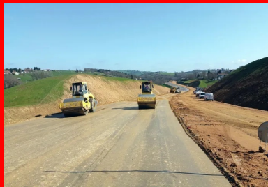
Le tronçon 2 x 2 voies sur 4,5 km implique la création d'une plate-forme de 25 m, qui nécessite environ 700 000 m 3 de terrassement. Au total, l'opération une fois achevée se soldera par le traitement de 115 000 m 2 de couche de forme au liant hydraulique routier.

À cet endroit précis, la création d'une 2 x 2 voies sur 4,5 km, avec une largeur de plate-forme de 25 m, implique de réaliser environ 700 000 m 3 de terrassement. Au total, l'opération se traduira par le traitement de 115 000 m 2 de couche de forme au liant hydraulique routier (LHR). Liant choisi : le LV TS 03, produit par la cimenterie Vicat de Créchy (Allier). Un choix logique, selon la DIR Centre-Est : « Il s'agit d'une technique classique, mais avec des conditions de mise en œuvre particulières, précise Julien Champeymond. Une analyse géotechnique globale, réalisée sur l'ensemble du tracé, a permis de trouver, dans les déblais de la partie nord, un gisement important de matériaux qui se prêtent bien au traitement au liant hydraulique. Du coup, il était plus pertinent de traiter ce que l'on a trouvé sur place plutôt que de faire venir des matériaux de l'extérieur pour obtenir les résistances mécaniques que nous souhaitons. »