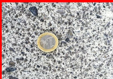
Les granulats (Courbaisse) proviennent de l'arrière-pays niçois.