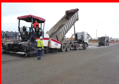
AER travaille à Orly depuis 2014.

« Nous sommes présents en continu sur Orly depuis juin 2014, avec le chantier de dévoiemment de la voie W2, réalisé de juin 2014 à juin 2015. À l'époque, il s'agissait de mettre en œuvre une structure béton de 40 000 m 2 , constituée d'une couche de roulement de 37 cm d'épaisseur et d'une fondation de 20 cm de Grave Traitée au Liant Hydraulique (GTLH), rappelle Bastien Lefèvre, ingénieur Travaux d'AER. De septembre 2015 à mars 2016, nous avons également réalisé le chantier de sécurisation des postes de la Jetée Est , avec 43 000 m 2 déjà en service et 11 000 m 2 réalisés, pour l'essentiel, cet été (39 cm de béton ER + 10 cm de béton poreux, fabriqués et mis en œuvre par AER sur 20 cm de GTLH, fabriquée par notre centrale AER et mise en œuvre par notre partenaire Roland). Sur le chantier de la jetée Est d'Orly, les caniveaux à couler en place représentent au total 470 mètres linéaires, dont 360 mètres linéaires déjà remis en exploitation. Nous avons également réalisé l'extension de la voie W37, avec 7 500 m 2 de voies béton (40 cm de béton ER + 10 cm de béton poreux, fabriqués et mis en œuvre par AER sur 20 cm de GTLH) ainsi que 120 mètres linéaires de caniveaux à fente (diamètre de 400 à 500 mm) coulés en place. »