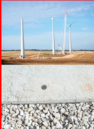
Des éoliennes E82/2300 en cours d'assemblage.

Le site de Joux-la-Ville sera opérationnel au printemps 2017. [article publié en septembre 2016]