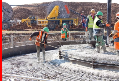
Pour réaliser les massifs de fondation des éoliennes, environ 100 kg d'armatures sont nécessaires par mètre cube de béton.