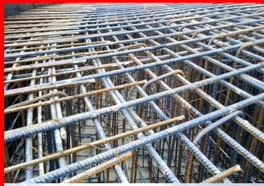
Mise en place du ferrailage par la Société d'armatures spéciales.

Trois ans d'études ont été nécessaires pour valider le projet éolien, analyser la topographie des lieux et la fréquence de leurs vents. L'examen des recours a également pris plusieurs années, avant que soit obtenu le feu vert juridique. Le parc comprend donc 27 éoliennes - de 102 m de hauteur et dotées d'un rotor de 82 m de diamètre -, ce qui en fait le plus important de Bourgogne. Le maître d'ouvrage, Enercon, constructeur des éoliennes, a confié le chantier de terrassament et des fondations à la société Etchart, une entreprise de génie civil et maritime, basée à La Rochelle. Cemex a été chargée de la fourniture et de la mise en place à la pompe du béton dans les massifs de fondation, dont le ferrailage, particulièrement technique, a été réalisé par la Société d'armatures spéciales, basée à Criquebeuf-sur-Seine (Eure).