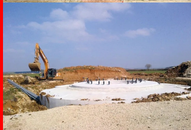
Un massif de fondation d'éolienne nécessite la mise en œuvre d'environ 400 m 3 de béton. Poids total : un millier de tonnes.