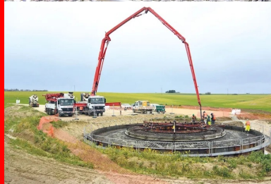
Opération de coulage du béton : le massif de fondation circulaire d'une E82/2300 mesure environ 9 m de rayon, soit 250 m 2 de surface.