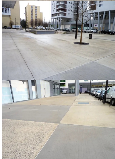
Trois types de bétons ont été retenus pour le revêtement de la place du Général-de-Gaulle : un béton brossé pour les zones piétonnes, un béton bouchardé, permettant le passage occasionnel de gros véhicules, et un béton hydrogommé pour la partie circulée de l'espace.