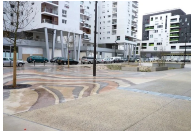
La place du Général-de-Gaulle, à Ivry-sur-Seine. Parmi les enjeux incontournables, la Ville souhaitait laisser une place à la voiture, en termes de stationnement comme de circulation.

S'appuyant sur l'orientation des bâtiments alentour – un large front bâti avec plusieurs percées –, la réflexion de l'équipe d'Urbicus s'oriente rapidement vers le dessin d'un espace monopenté au milieu duquel se succèdent trois grandes noues, plantées de végétaux appréciant les milieux humides, de type saule et autres graminées, qui permettent de récolter les eaux de ruissellement. « Selon la traduction que nous avions pu faire du cahier des charges de l'aménageur, en l'occurrence l'AFTRP (1), la place devait être la plus simple possible, à savoir surtout minérale, explique Rudy Blanc, l'architecte paysagiste ayant conduit le projet pour Urbicus. Elle devait aussi pouvoir accueillir des manifestations publiques. » Autre enjeu incontournable : la volonté de la municipalité de laisser une place à la voiture.