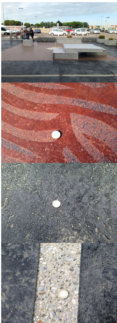
Le béton noir imprimé en motifs légers est traversé par une bande de guidage au sol pour sécuriser le déplacement des personnes aveugles ou malvoyantes (PAM). À l'arrière du banc en béton, une bande d'éveil à la vigilance (BEV).

« Il fallait relooker la galerie commerciale dont l'apparence avait pris pas mal de rides, en profiter pour créer de nouvelles cellules commerciales et gagner de la surface de vente. Nous sommes donc allés chercher un morceau de l'emprise nouvelle sur le parking pour gagner de la surface commerciale. Au-delà, nous avons créé un sas de 100 m 2 environ en imitation Corten qui fait le lien entre la zone de stationnement et la galerie proprement dite, ainsi qu'une fausse façade. » Le tout donc pour densifier l'offre commerciale en ajoutant potentiellement 6 à 7 boutiques nouvelles à celles déjà présentes dans la galerie.