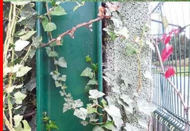
Des poteaux de soutien en forme de H maintiennent les panneaux d'un poids unitaire de 2,5 tonnes, qui sont rigidifiés grâce à une voile de béton de 10 cm, situé à l'arrière. Ils sont équipés de grilles anti-tags.