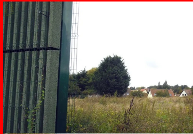
Montés seuls ou par deux, l'un sur l'autre, les panneaux protègent les zones résidentielles des tronçons où la circulation est la plus bruyante