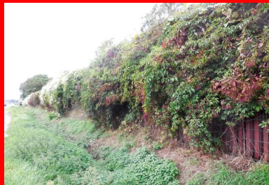
Réalisables en plusieurs couleurs (gris ciment, vert et, ici, rouge), les panneaux peuvent être végétalisés, jusqu'à être complètement dissimulés sous le feuillage.

Le procédé TRAC, en apparence paradoxal, consiste « à assembler un matériau organique déformable avec un liant minéral rigide » pour réaliser un matériau de construction « à la fois massif et souple ». Il est obtenu par l'agglomération de granulats de caoutchouc avec une pâte cimentaire. Issus du recyclage de Pneumatiques usagés non rechapables (PUNR), ils sont d'une taille variant entre 1 et 5 mm, moins coûteux à fabriquer que des particules fines de caoutchouc, et liés à l'aide d'une matrice hydraulique de type ciment ou liants hydrauliques. Ces granulats font l'objet d'un cahier des charges très précis définissant leurs caractéristiques intrinsèques et de fabrication, notamment en termes de fuseau granulométrique, coefficient de forme, propreté et caractéristiques de surface.