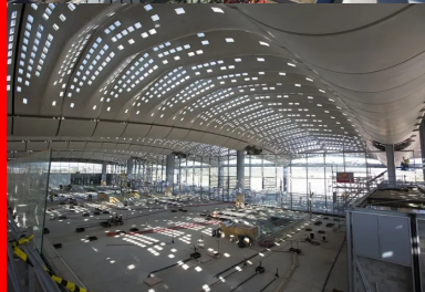
En sous-face, les coques habitent la structure et forment avec les palmes une surface à double courbure.