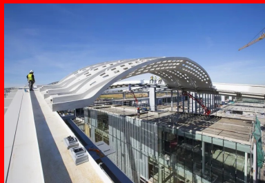
Les palmes sont réparties en cinq travées de 23 unités.