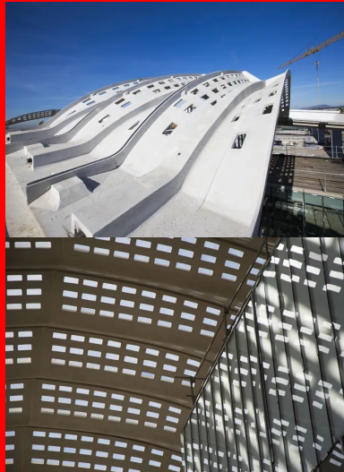
Au centre des palmes, les câbles de précontrainte passent dans une cage d'armatures pour reprendre les efforts en torsion.

BFUP : 750 m 3 , 115 palmes, 480 coques, 150 éléments de casquette