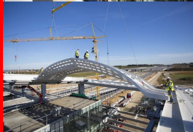
Elles sont mises en place avec une grue de 1 200 t et de 100 m de flèche.