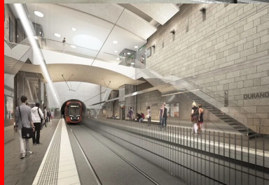
Future station Surandy : les parois moulées seront recouvertes de parements de pierre.