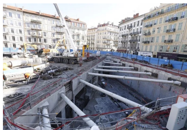
Station Durandy : butonnage des parois moulées d'une des « boîtes ».

L'évacuation des quelque 200 000 m 3 de déblais de forage du tunnel représentait une autre gageure et une exigence forte du maître d'ouvrage, soucieux de réduire au maximum les nuisances. Une fois excavés et concassés par le tunnelier, puis mélangés à de la boue, les déblais ont été évacués au fur et à mesure de la progression du tunnelier, via une conduite de marinage souterraine, puis acheminés vers la centrale de traitement implantée sur le port. Là, ils ont été exfiltrés par la mer, après avoir été « asséchés ». Plusieurs fois par semaine, de grandes barges chargées de plus de 2 000 tonnes de déblais ont effectué des rotations vers une plate-forme de recyclage située à Fos-sur-Mer. Pour la réalisation du tunnel, le port de Nice s'est ainsi mué en centre névralgique : en effet, une deuxième canalisation, est-ouest celle-là, a permis d'alimenter le tunnel en boue bentonitique, indispensable pour stabiliser le front de taille lors du creusement, avant la mise en place des voussoirs.