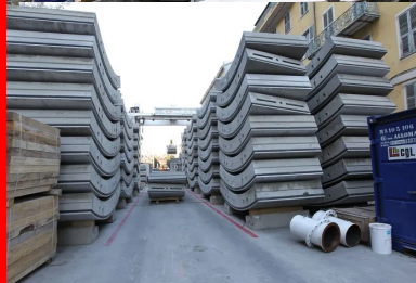
Rue Ségurane : sur la zone de chantier, stockage des voussoirs en flux tendu, en raison de l'exiguïté des lieux.