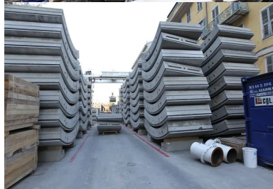
Rue Ségurane : sur la zone de chantier, stockage des voussoirs en flux tendu, en raison de l'exiguïté des lieux.