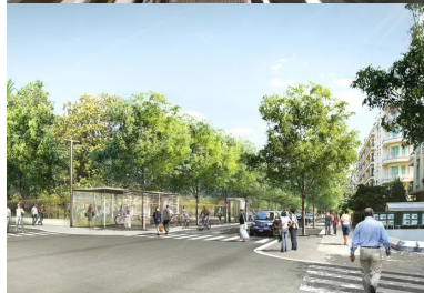
Vue 3d de la station alsace-lorraine.