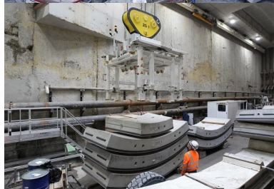
Puits d'entrée du tunnel, manutention des voussoirs de 6 tonnes chacun.