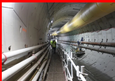
Intérieur du tunnel avec la conduite de maréage pour l'exfiltration des déblais et la canalisation de boue bentonitique.

Ciments Vicat : CEM III/B 42,5 N LH SR ; CEM II/A-S 42,5 N ; CEM I 52,5 N