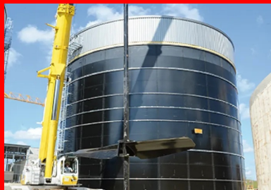
Phase de levage d'un agitateur pendulaire...

« Rentabiliser la méthanisation à cette échelle industrielle est un cas concret d'économie circulaire où ces déchets nés de l'activité humaine sont régénérés pour retourner à la terre et l'enrichir, explique Aymeric Minot, responsable Développement chez Eneria. Le procédé est avantageux pour les économies locales puisque les collectivités tirent bénéfice d'une création d'emplois non délocalisables : ici, 16 personnes embauchées à plein temps pour le transport des « marchandises » et l'exploitation de l'unité. Dans le même temps, le système favorise l'autonomie énergétique territoriale en participant à la production locale d'énergie renouvelable. Les abouissements environnementaux sont également multiples puisque l'unité de méthanisation offre une solution efficace pour gérer collectivement les effluents, préserver les sols, améliorer le bilan carbone et diminuer la production de gaz à effet de serre , si la concentration des déchets peut paraître une mauvaise nouvelle pour le voisinage, nous avons porté tous nos efforts sur la gestion des nuisances olfactives... qui sont, quoi qu'il en soit, sans commune mesure avec l'odeur des épandages. »