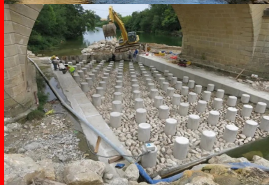
Les « menhirs » de 50 cm de diamètre et hauts de 90 cm, laissant une hauteur utile de 50 cm, sont ancrés dans un radier en béton armé. Au-dessus, des enrochements secondaires disposés de façon aléatoire ont été scellés dans un bain de mortier.