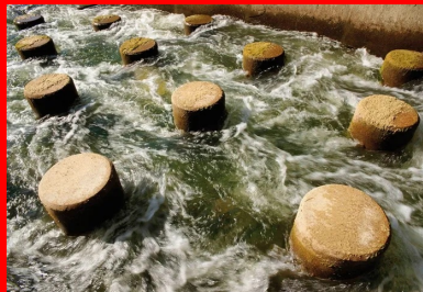
Les 113 cylindres de béton cassent la dynamique de l'eau et permettent aux poissons de se reposer lorsqu'ils remontent le courant.

Lors de l'édition 2014 du Prix Infrastructures – Mobilité – Biodiversité (IMB), 23 projets et initiatives ont concouru. La création de la passe à poissons dans le lit du Vidourle a été récompensée par le 1er prix dans la catégorie « génie écologique » décerné à la Direction Régionale Languedoc-Roussillon de RFF (SNCF Réseau) et l'Agence de l'eau. Le Prix IMB est organisé depuis 2010 par l'Institut des Routes, des Rues et des Infrastructures pour la Mobilité (IDRRIM). Il récompense chaque année les meilleures initiatives prises par les acteurs impliqués dans la conception, la construction, la gestion, l'entretien, l'aménagement, la requalification et l'exploitation des infrastructures de mobilité en faveur de la préservation, de la restauration et de la valorisation des écosystèmes et de la biodiversité.