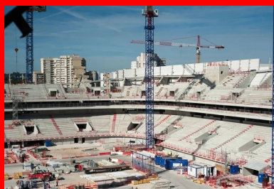
Vue de l'intérieur de l'Arena.

Quant à la teinte du béton, l'architecte Christian de Portzamparc souhaitait une teinte se rapprochant le plus possible de celle de l'Arche, qui est juste en ligne de mire, un ton pierre blanche.