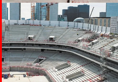
L'Arena : seul ouvrage en courbes dans un univers rectiligne.

Maître d'ouvrage : Racing Arena - Maître d'œuvre : Cabinet d'architecture Elizabeth & Christian de Portzamparc et Avel acousticien - Entreprise : Vinci Construction France - Mandataire de l'opération conception-construction : GTM Bâtiment en groupement avec Petit, Chantiers Modernes et TPI - Bureau d'études : SIDF - Coût : 400 M€ HT dont 220 M€ pour l'Arena et 180 M€ pour les bureaux.