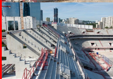
Gradins préfabriqués et portiques coulés en place.