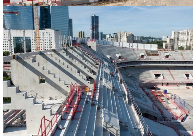
Gradins préfabriqués et portiques coulés en place.