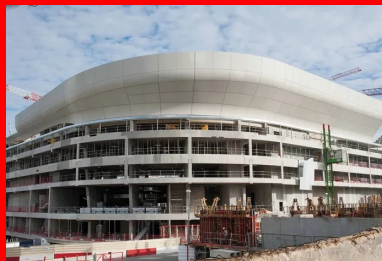
L'arena 92, et son couronnement de coques préfabriquées en béton de ciment blanc, réalisées par l'entreprise Joussein (angers).

La partie immergée de l'ouvrage est complexe, car celui-ci est implanté au-dessus d'un véritable gruyère, et tient compte des futurs projets portés par l'Epadesa2 et RFF. Ainsi aujourd'hui, outre le passage en souterrain de l'autoroute A 14 au sud et au nord-ouest de la parcelle, le sous-sol sud-ouest est occupé par une usine de ventilation sur laquelle prend appui la superstructure de l'Arena ! Soletanche Bachy, qui a réalisé l'ensemble des travaux de fondations, a aussi modélisé et réservé le passage souterrain de la future ligne Eole. Le dimensionnement des 200 pieux, de 60 à 120 cm de diamètre, est fonction de la profondeur à laquelle ils prennent appui, jusqu'à 22 m pour les plus profonds, et des structures qu'ils supportent : gradins, voiles des bureaux, ou « pelouse » du stade. Les surcharges prévisibles, comme les spectateurs, et les aléas tels que le vent ont aussi été pris en compte pour leur dimensionnement. « Notre BE Structure a modélisé l'ensemble de l'opération afin de calculer tous les efforts point par point », précise encore le directeur des travaux. L'intervention de Soletanche Bachy a aussi porté sur la réalisation des parois de 20 à 25 cm d'épaisseur en béton projeté sur un treillis soudé et clouté de 6 à 7 m de hauteur, qui forme l'enceinte du sous-sol. Il comprend un niveau de parking de 480 places.