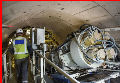
Pour améliorer le calendrier général du projet, deux tunneliers creusent simultanément des portions différentes du tunnel principal long de 5,8 km.

Le tronçon nord est réalisé par Bouygues Travaux Publics/Soletanche Bachy France/ Soletanche Bachy tunnel/CSM Bessac. « Solenne », le tunnelier de ce groupement, fabriqué par NFM Technologies, doit réaliser 1 719 m de tunnel entre la future station Clichy Saint-Ouen RER et la rue Marcel Cachin, à Saint-Denis. Assemblé au fond de la « boîte » de l'ouvrage annexe place du Capitaine Glarner, à une trentaine de mètres sous la surface du terrain naturel, il a démarré son creusement en 2016 en direction de Mairie de Saint-Ouen. C'est aussi lui qui réalisera sur 501 m le raccordement souterrain au Site de Maintenance et de Remisage (SMR) des rames, seule une courte portion, dans le quartier des Docks de Saint-Ouen, étant effectuée en tranchée couverte depuis la surface. Enfin, « Solenne » reviendra à son point de départ et sera retourné pour creuser le tronçon rejoignant la station Clichy Saint-Ouen. Les deux tunneliers fonctionnent 24 heures sur 24, de cinq à sept jours par semaine, à raison de 12 m d'avancement moyen au quotidien, soit une cadence d'environ 250 m par mois. Chaque chantier occupe environ 70 techniciens répartis en trois postes.