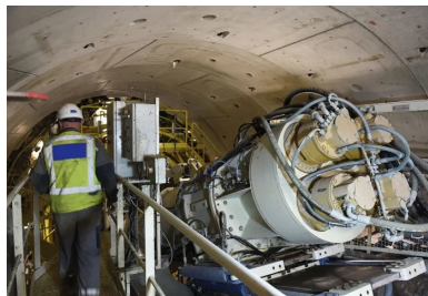
Pour améliorer le calendrier général du projet, deux tunneliers creusent simultanément des portions différentes du tunnel principal long de 5,8 km.

Le tronçon nord est réalisé par Bouygues Travaux Publics/Soletanche Bachy France/ Soletanche Bachy tunnel/CSM Bessac. « Solenne », le tunnelier de ce groupement, fabriqué par NFM Technologies, doit réaliser 1 719 m de tunnel entre la future station Clichy Saint-Ouen RER et la rue Marcel Cachin, à Saint-Denis. Assemblé au fond de la « boîte » de l'ouvrage annexe place du Capitaine Glarner, à une trentaine de mètres sous la surface du terrain naturel, il a démarré son creusement en 2016 en direction de Mairie de Saint-Ouen. C'est aussi lui qui réalisera sur 501 m le raccordement souterrain au Site de Maintenance et de Remisage (SMR) des rames, seule une courte portion, dans le quartier des Docks de Saint-Ouen, étant effectuée en tranchée couverte depuis la surface. Enfin, « Solenne » reviendra à son point de départ et sera retourné pour creuser le tronçon rejoignant la station Clichy Saint-Ouen. Les deux tunneliers fonctionnent 24 heures sur 24, de cinq à sept jours par semaine, à raison de 12 m d'avancement moyen au quotidien, soit une cadence d'environ 250 m par mois. Chaque chantier occupe environ 70 techniciens répartis en trois postes.