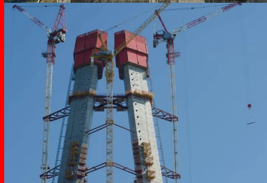
Au-delà, par un coffrage grim pant.