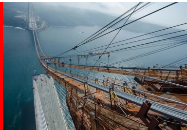
... avec des fûts convergents réunis par une entretoise en partie supérieure.