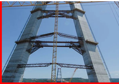
Les appuis, les travées de rive et les massifs d'ancrage sont en béton.

Concessionnaire : Astaldi S.p.A ; IC İctas Insaat – Conception : Michel Virlogeux ; Jean-François Klein T Ingénierie – Contrôle pour le concessionnaire : Setec tpi – Études géotechniques : Lombardi – BET : T Ingénierie – Essais en soufflerie : CSTB, Politecnico di Milano – Haubans et câbles de suspension : Freyssinet – Entreprises : Astaldi S.p.A ; IC İctas Insaat ; Hyundai Engineering & Construction ; SK Engineering & Construction Joint Venture ; Freyssinet – Calendrier : février 2012 – août 2016 – Coût : 900 M$.