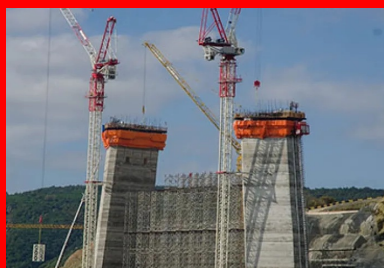
Ils sont réalisés jusqu'à 208 m de hauteur avec un coffrage glissant.

Ce prix exceptionnel remis par l' International Association for Bridge and Structural Engineering distingue des structures remarquables, innovantes, créatrices et stimulantes partout dans le monde. Il a été attribué le 19 septembre 2018 lors du 40e Symposium IABSE à Nantes en France.