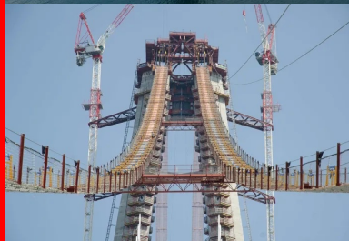
Les pylônes sont de section triangulaire variable...