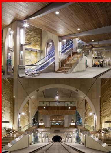
Système des arches évidées en diagonale pour les escaliers : les engravures des piliers accueillent les éclairages.

Ce n'est pas une « simple » opération puisque la planéité du béton doit être parfaite avec une tolérance proche du millimètre, malgré plusieurs courbes dans le tunnel. Par ailleurs, afin d'augmenter l'adhérence des pneus du tramway, le béton a été hydrodécapé sur toute la longueur de la voie, de part et d'autre des deux rails de guidage du tramway dans chaque sens de circulation.