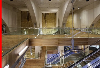
Jeu de contrastes des bétons bruts : les arches en béton blanc et les parois moulées.

Le prolongement de la ligne de tramway T6, Châtillon-Vélizy-Viroflay, soit environ 2 km, est en partie souterrain : le tunnel plonge sous la colline avec une pente de près de 10 %, pour desservir les deux gares souterraines, Viroflay Rive Gauche puis Viroflay Rive Droite. Cette configuration particulière a influencé le mode constructif des gares situées à quelques centaines de mètres l'une de l'autre, mais connectées à différents pôles de transports.