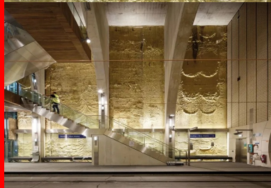
Paroi moulée et arches de soutènement, à l'entrée du tunnel. Le long, les bancs en béton blanc.

VIDEO. La gare de Viroflay a été distinguée aux ACI Excellence dans la catégorie Infrastructures Awards en 2018