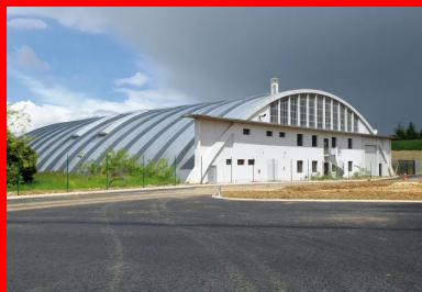
Vue du pignon est, muré par l'adjonction d'appentis intérieur.

Mais c'est en 1919 à Villacoublay que Freyssinet réalise une des plus belles structures de hangar à voûtes, également détruite en 1944. Située à côté des hangars Piketty construits en 1918 sur les mêmes bases que les hangars de type Lossier, le hangar de Freyssinet est constitué par la juxtaposition de trois voûtes en berceau parallèles, coupées par deux autres voûtes centrales perpendiculaires joignant la clé des premières voûtes. La surface intérieure libre de tout poteau atteignait 120 m de largeur par 45 m de profondeur, correspondant par là même au projet de hangar imaginé par Freyssinet dès 1913.