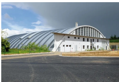
Vue du pignon est, muré par l'adjonction d'appentis intérieur.

Mais c'est en 1919 à Villacoublay que Freyssinet réalise une des plus belles structures de hangar à voûtes, également détruite en 1944. Située à côté des hangars Piketty construits en 1918 sur les mêmes bases que les hangars de type Lossier, le hangar de Freyssinet est constitué par la juxtaposition de trois voûtes en berceau parallèles, coupées par deux autres voûtes centrales perpendiculaires joignant la clé des premières voûtes. La surface intérieure libre de tout poteau atteignait 120 m de largeur par 45 m de profondeur, correspondant par là même au projet de hangar imaginé par Freyssinet dès 1913.