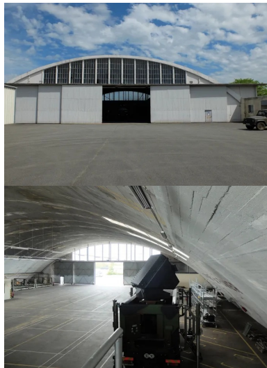
Vue du pignon ouest : les portes datent de 1945.

2 - Construction Moderne - Annuel Ouvrages d'art 2013.