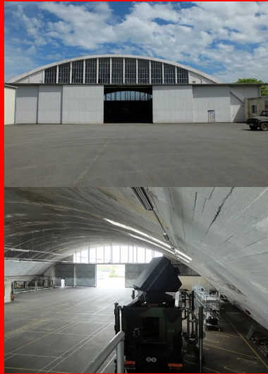
Vue du pignon ouest : les portes datent de 1945.

2 - Construction Moderne - Annuel Ouvrages d'art 2013.