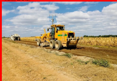
chantier de la RD7