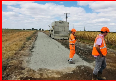
chantier de la RD7