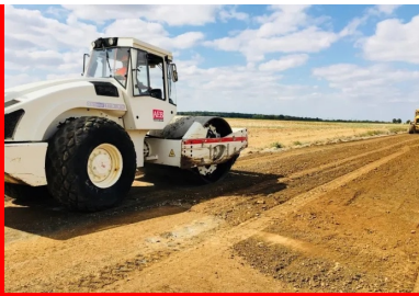
chantier de la RD7

Les journées techniques "Valorisation des matériaux en place aux liants hydrauliques" s'adressent à tous les acteurs concernés par la construction et l'entretien des routes : les élus et leurs services techniques, les bureaux d'études et tous les professionnels de la route.