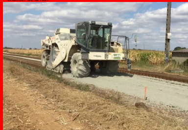
chantier de la RD7