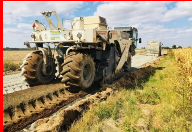
chantier de la RD7