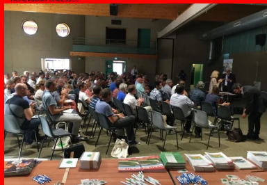
Journée technique LHR