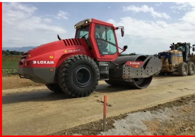
Retraitement des chaussées en place aux lants hydrauliques routiers