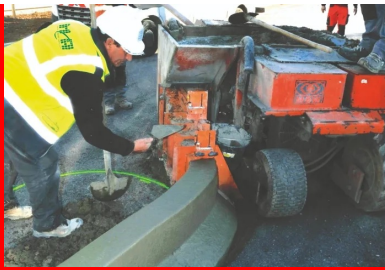
Les grandes étapes de la réalisation des bordures en béton extrudé