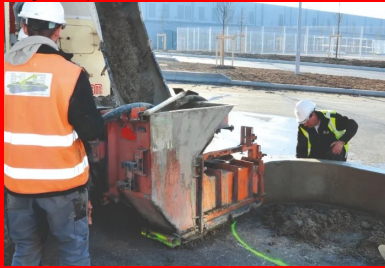
Les grandes étapes de la réalisation des bordures en béton extrudé