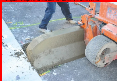
Les grandes étapes de la réalisation des bordures en béton extrudé