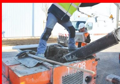
Les grandes étapes de la réalisation des bordures en béton extrudé