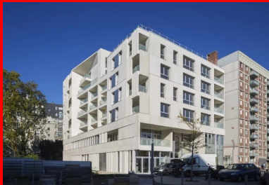
Le bâtiment et son épandage progressif avec, à droite, la barre voisine en R+10.

Plus inhabituels et eux aussi préfabriqués in situ, des réflecteurs de lumière en béton blanc lisse agrémentent la façade nord, tels de petits drapeaux rivés à la paroi. Enfin, pour réaliser la casquette à pans obliques qui couronne le bâtiment, le béton blanc fibré a lui aussi été coulé en place, mais dans un moule spécifique réalisé en atelier.