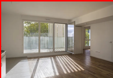
Des appartements lumineux et dotés de matériaux de qualité.

Cette « sculpture » du volume sur ses quatre faces répond à une volonté architecturale tout en générant des volumes intérieurs de qualité et une plus grande interaction entre intérieur et extérieur. Ainsi, le biais créé en façade le long des 1 er et 2 e avenues permet de marquer les entrées mais surtout de multiplier les orientations et l'accès à de meilleures perspectives visuelles dans les appartements - une habile façon de pallier la compacité du bâtiment. Les différents évidements sont l'occasion d'offrir à chaque logement un espace extérieur, à la fois ouvert sur la ville et protégé, protection renforcée par l'ajout de brise-soleil et de garde-corps sérigraphiés. Les circulations bénéficient d'un éclairage naturel et d'une vue imprenable sur la cité.