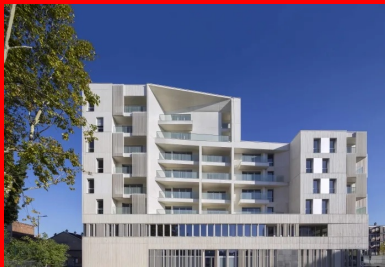
Façade côté place Marcel Cachin, en R+5, pour intégrer l'échelle des constructions bordant cet espace public.

En termes de volume, le bâtiment ne se perçoit pas comme une barre. Ceci est dû en partie à son épannelage progressif, avec une construction en R+5 côté place et en R+7 côté avenue Lénine, en réponse à un environnement constitué de petites barres en R+4 autour de la place Marcel Cachin et d'immeubles en R+10 le long de l'avenue Lénine. Outre cette répartition volumétrique, c'est avant tout par le traitement des angles et par un subtil travail de biais et d'évidements que le bâtiment ne dévoile pas immédiatement au passant son échelle réelle.