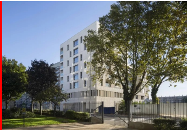
Le long de l'avenue Lénine, la façade d'accès au parking, là encore un traitement des angles offrant un effet de rebroussement et une continuité visuelle sur l'ensemble du bâtiment.

Précisément, les architectes souhaitant offrir la perception d'un monolithe de béton blanc , les retours sur angle, les sous-faces et faces arrière, ainsi que des pans intérieurs ont été travaillés dans ce sens. En termes d'enveloppe, leur volonté était de créer un effet de matière qui accentue la sensation d'un grand bloc minéral à la peau rugueuse que l'on aurait évidé pour y créer des ouvertures. Leur choix s'est porté sur un béton matricé imitation bois, de deux types, l'un à effet planches larges et l'autre à lames étroites. Les façades ont été moulées et coulées en place avec une pose des matrices à la verticale quant au motif des planches et ce, pour deux raisons : il semblait important d'affiner la silhouette de la construction, mais aussi de faciliter le ruissellement des eaux de pluie, pour éviter, à terme, un encrassement des façades. La partition des panneaux à lames larges et étroites ne semble pas répondre à une logique apparente. Leur position, à priori aléatoire, renforce l'effet vibratoire apporté par le jeu des rythmes verticaux, qu'il s'agisse des joints entre panneaux, des reliefs des bords de planches, des brise-soleil, etc.