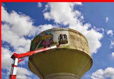
La Cou lure - Château d'eau de Blanz y, 2014.

En 2009, alors que l'autoroute des Tamarins se termine, Jace et ses complices repeignent en une nuit un mur de soutènement de 1 000 m 2 . La région finira par entériner l'œuvre et ne fera changer que le fond bleu de la fresque.