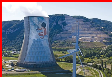
Jean-Marie Pierret - Le Verseau, 1991. Centrale nucléaire de Cruas.

C'est en empruntant un chemin de randonnée que l'on découvre la fresque de Ella & Pitir. Ils travaillent ensemble depuis plus de 10 ans et sont connus pour leurs peintures géantes au sol ou sur les toits, représentant des « colosses endormis » dans le chaos des villes. De nombreuses créatures du duo stéphanois sont en train de dormir les jambes ramassées, contraintes par le cadre imposé du support choisi, comme au barrage de la commune de La Valla-en-Gier au Pilat, avec la fresque « Le Naufrage de bienvenue ». Une commande de la ville de Saint-Etienne ayant demandé 10 jours de travail. Ce nouveau géant de 47 m de hauteur et au calme étrange du sommeil des enfants est appelé à s'inscrire dans le patrimoine régional. Il est porteur d'un ailleurs, d'autres possibilités de vie et de rêves à inventer. Une échappée belle poétique, esthétique et politique.