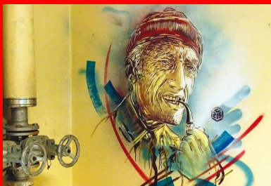
C215 - E = MC215 - commandant Jacques-Yves Cousteau, 2015. CEA de Saclay.

Diderot soulignait que « le patrimoine, c'est aimer et désirer ce que l'on possède déjà », pourtant le patrimoine, c'est aussi le mélange des cultures. Ainsi, comme l'ont montré les Streets artistes à travers le monde, les graffitis et le Génie Civil à priori antinomiques, se rejoignent sur le terrain de l'art.