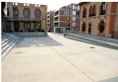
Le revêtement du parvis a été réalisé en Articimo® Bouchardé (PSP 350 kg CE2.5 N CE CP1 NF D10 S3).

Entamés au mois de mars 2016, les travaux d'aménagement du château se sont achevés en juin 2017, de sorte à permettre l'ouverture du nouvel espace en septembre. Menée en parallèle et dans le même temps par la ville de Nanterre, l'opération d'aménagement des environs de l'usine du D r Pierre s'est également achevée. Elle a permis la construction d'un ensemble de bureaux, d'un parking et de logements en accession à la propriété.