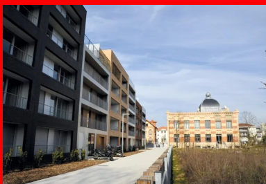
Vue générale du château de Nanterre. Au premier plan, les allées extérieures en béton décoratif réalisées entre mai et juin 2017.

Classé monument historique en 1992, le vaste bâtiment a connu plusieurs vies : il fut d'abord une fabrique de dentifrice - l'« usine du Dr Pierre » -, avant d'accueillir, jusqu'en 2006, les locaux d'une marque de vêtements pour bébés et futures mamans. Rénovée et rebaptisée le « château », l'élégante construction en briques rouges de la Belle Époque sert désormais de laboratoire dédié aux arts de la bouche et aux structures à impact positif. Pour y accéder et le valoriser sans en dénaturer le cachet, les maîtres d'ouvrage et d'œuvre ont choisi le béton bouchardé . Le résultat, très qualitatif, est à la hauteur de l'exigence !