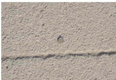
Le revêtement du parvis a été réalisé en Articimo® Bouchardé.

Au total, un volume de 350 m 3 a été mis en œuvre. Commencés en mai, les allées piétonnes et le parvis ont été achevés en juin 2017.