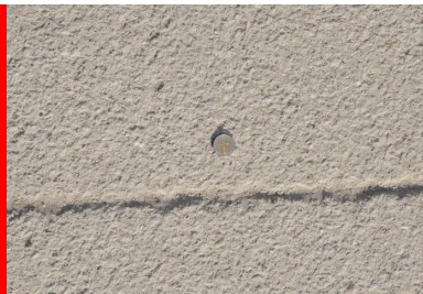
Le revêtement du parvis a été réalisé en Artcime® Boucharde