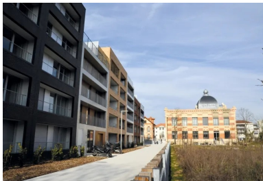
Vue générale du château de Nanterre. Au premier plan, les allées extérieures en béton décoratif réalisées entre mai et juin 2017.

Classé monument historique en 1992, le vaste bâtiment a connu plusieurs vies : il fut d'abord une fabrique de dentifrice - l'« usine du Dr Pierre » -, avant d'accueillir, jusqu'en 2006, les locaux d'une marque de vêtements pour bébés et futures mamans. Rénovée et rebaptisée le « château », l'élégante construction en briques rouges de la Belle Époque sert désormais de laboratoire dédié aux arts de la bouche et aux structures à impact positif. Pour y accéder et le valoriser sans en dénaturer le cachet, les maîtres d'ouvrage et d'œuvre ont choisi le béton bouchardé . Le résultat, très qualitatif, est à la hauteur de l'exigence !