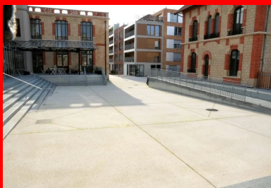
Le revêtement du parvis a été réalisé en Articimo® Bouchardé (PSP 350 kg CE2.5 N CE CP1 NF D10 S3).

Entamés au mois de mars 2016, les travaux d'aménagement du château se sont achevés en juin 2017, de sorte à permettre l'ouverture du nouvel espace en septembre. Menée en parallèle et dans le même temps par la ville de Nanterre, l'opération d'aménagement des environs de l'usine du D r Pierre s'est également achevée. Elle a permis la construction d'un ensemble de bureaux, d'un parking et de logements en accession à la propriété.