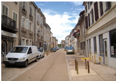
Rue de la République après aménagement.

À 9 km à l'ouest de Chalon-sur-Saône, en Bourgogne du Sud, Givry, porte de la côte chalonnaise, est connue pour ses domaines viticoles (AOC reconnue en 1946), son dynamisme socioculturel et ses nombreux monuments classés ou inscrits. Commune rurale, chef-lieu de canton du département de Saône-et-Loire, adhérente à la communauté d'agglomération du Grand Chalon, Givry compte aujourd'hui environ 3 950 habitants. D'origine gallo-romaine, Givry devient village fortifié au Moyen Âge, protégé à l'époque par des remparts s'ouvrant aux quatre points cardinaux. Au XVIII e siècle, Givry connaît une forte expansion grâce aux ressources que sont la forêt, le blé, la vigne... Les échevins décident de reconstruire l'hôtel de ville, ou porte de l'Horloge, à l'emplacement même de la porte Est. Émiland Gauthey et Thomas Dumorey en sont les architectes. C'est aujourd'hui un monument classé au titre des Monuments historiques, tout comme l'église Saint-Pierre-et-Saint-Paul, due, elle aussi, à Émiland Gauthey. Au fil du temps se sont ajoutés, au répertoire du patrimoine des Monuments historiques, d'autres édifices classés ou inscrits : Halle ronde, cellier aux Moines, croix, fontaines et lavoirs.