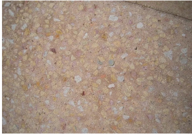
Rue de la République : aire de stationnement en béton bouchardé.

Nous attendons avec impatience la deuxième phase du projet d'aménagement, prévue en 2018.