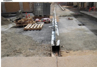
Rue de la République. Fondation en grave-bitume épaulant le caniveau à fente.