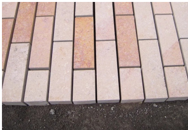
Le Buxy est une roche sédimentaire compacte. C'est un calcaire à grains fins et serrés et à petits cristaux de calcite, de couleur jaune-roux. Cette pierre naturelle peut présenter des taches ovalées et des zones flammées ou veinées de couleur lie-de-vin à mauve ou grise. Le Buxy est une pierre très dure, apte au grand trafic. Cette pierre peut être flammée pour obtenir une surface rugueuse antidérapante. Le Buxy est une pierre non gélive.