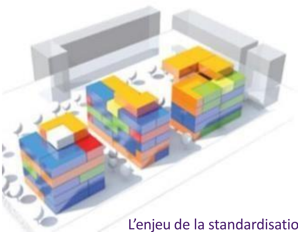
L'enjeu de la standardisation